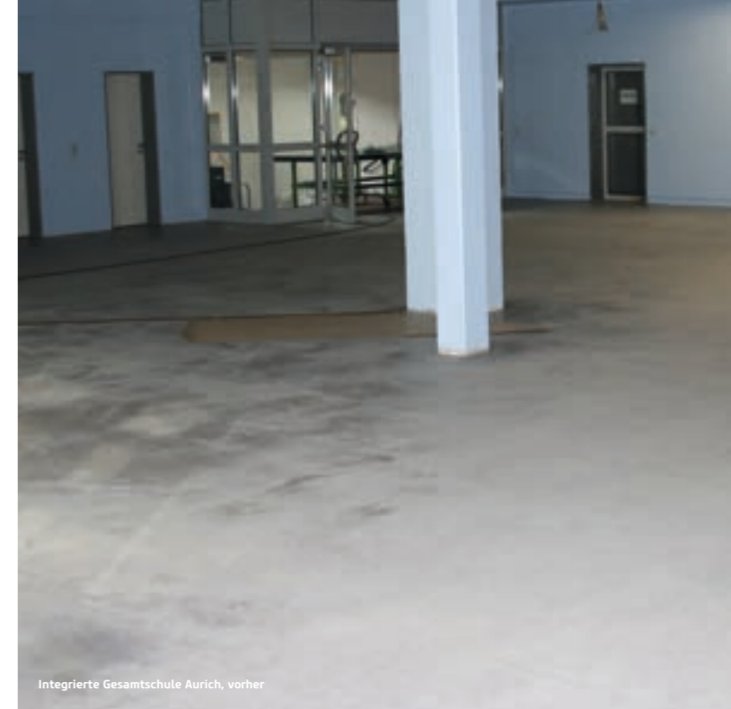
Integrierte Gesamtschule Aurich, vorher

Sichere Verarbeitung garantiert durch erfahrene und zertifizierte Dienstleistungspartner.