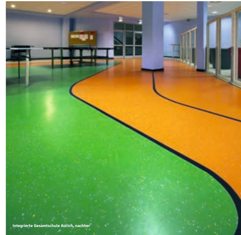
Integrierte Gesamtschule Aurich, nachher